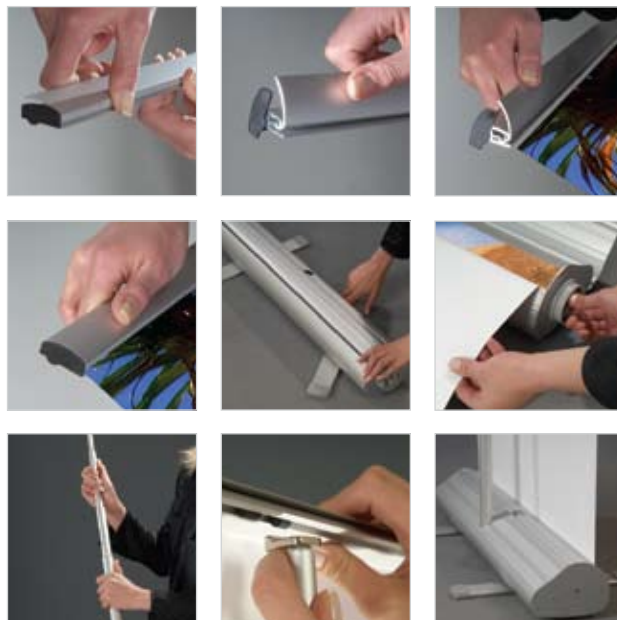
РОЛЛЕРНЫЕ СТЕНДЫ (ТУБУС в комплекте)